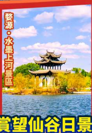
婺源·水墨上河景區