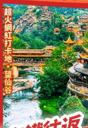
超火網紅打卡地·望仙谷