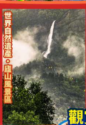
世界自然遺產·廬山風景區