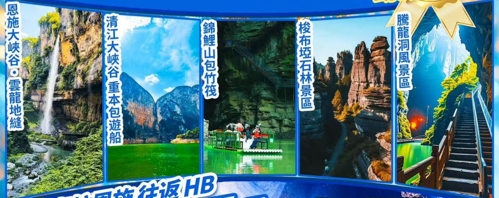
恩施大峽谷 雲龍地縫