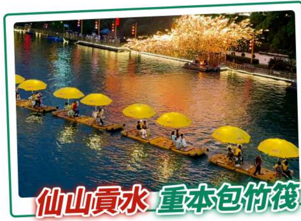
仙山貢水 重本包竹筏

酒店自助早餐 → 亞洲第一大溶洞【騰龍洞風景區】(重本包門票) → 恩施許家坪機場 → 乘坐飛機 (參考航班: HB539 1910-2125) → 抵達香港國際機場, 結束愉快行程!