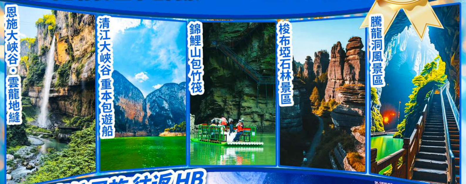
恩施大峽谷 雲龍地縫