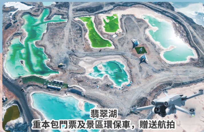
翡翠湖 重本包門票及景區環保車，贈送航拍