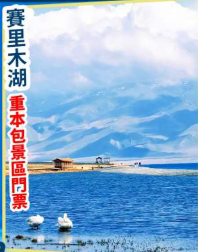
賽里木湖 重本包景區門票