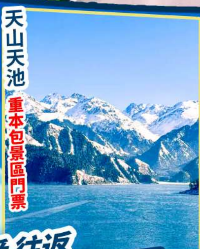
天山天池 重本包景區門票