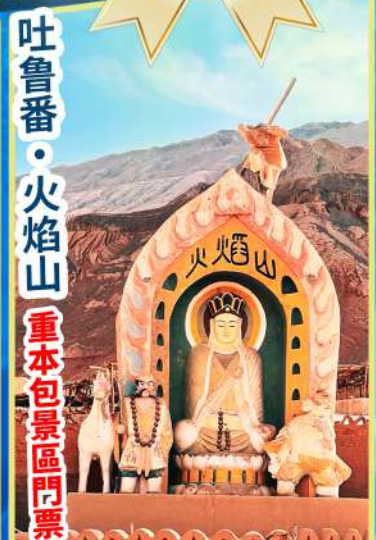
吐魯番·火焰山 重本包景區門票