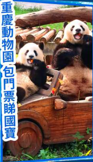
重慶動物園包門票睇國寶