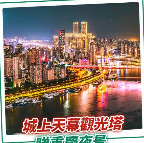
城上天幕觀光塔 睇重慶夜景