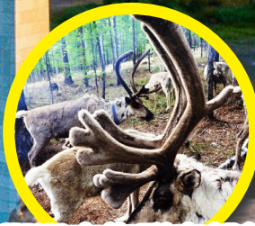
鄂溫克族馴鹿部落