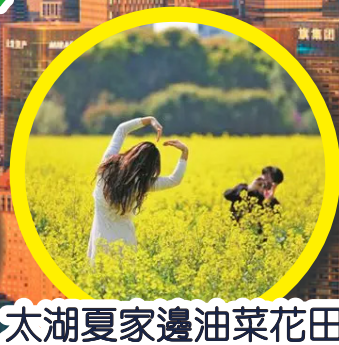
太湖夏家邊油菜花田