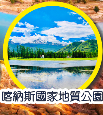
喀納斯國家地質公園