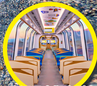
麗江雪山觀光列車