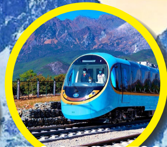
雪山全景觀光列車