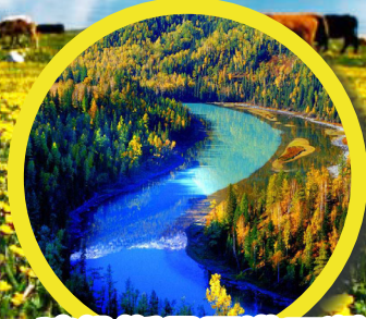
喀納斯景區遊三灣