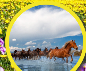
濕地公園天馬浴河

舒適入住：烏魯木齊野馬主題公園酒店 / 阿勒泰柏曼 / Melody班的酒店或同級