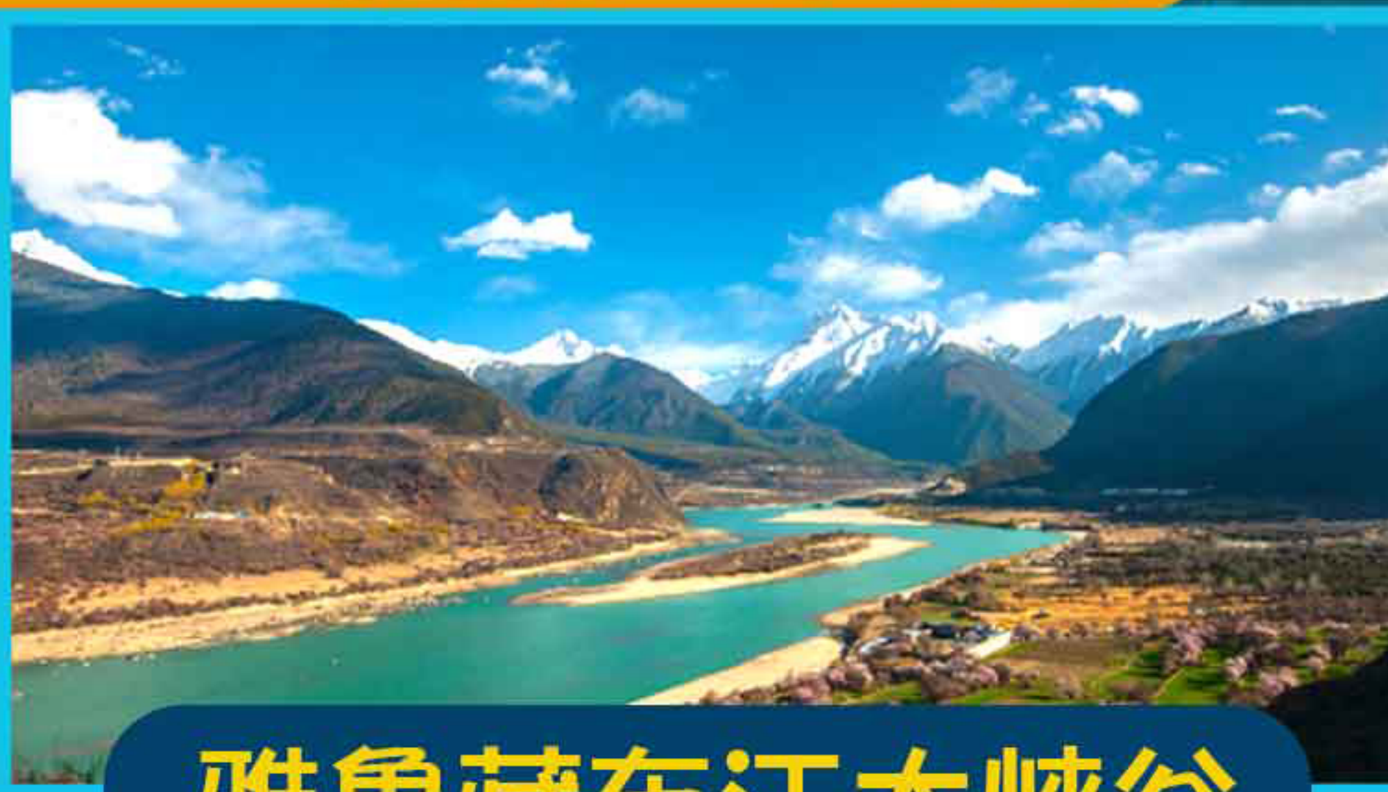
雅魯藏布江大峽谷