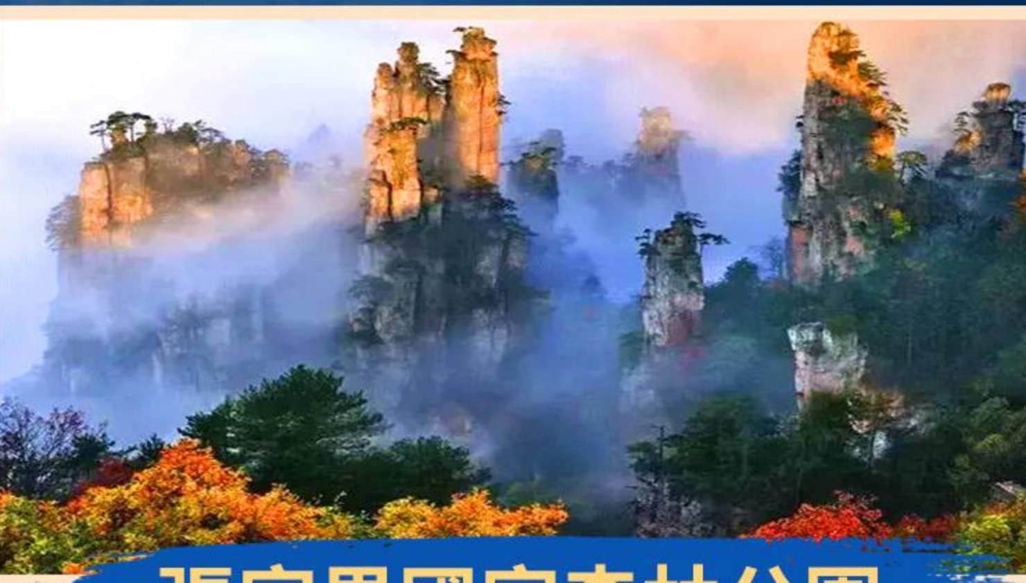
張家界國家森林公園