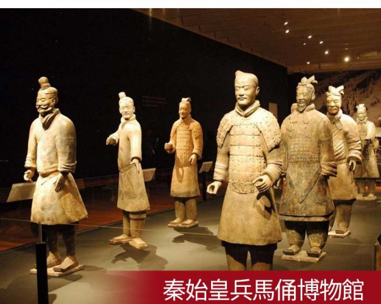
秦始皇兵馬俑博物館