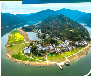
宏村 / 守拙園 / 新安江山水畫廊 / 篁嶺 / 西溪南