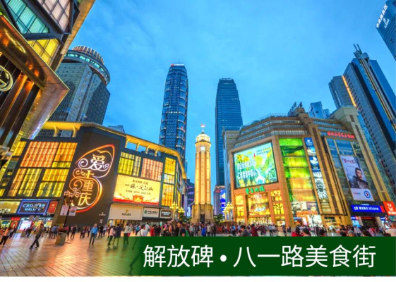
解放碑·八一路美食街