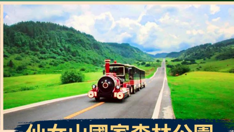
仙女山國家森林公園