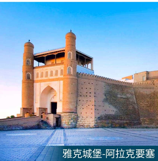
雅克城堡-阿拉克要塞