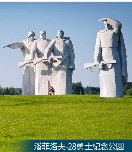
潘菲洛夫-28勇士紀念公園