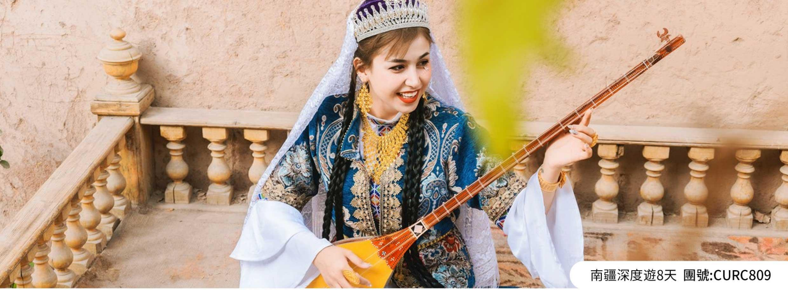
南疆深度遊8天 團號:CURC809