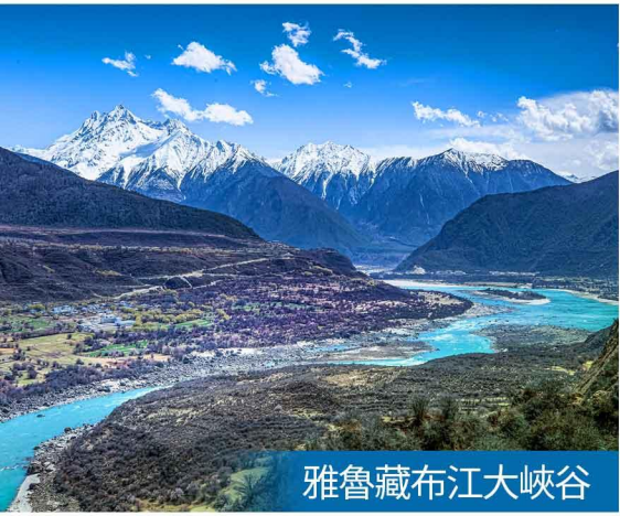
雅魯藏布江大峽谷

【乘坐火車提示】：沿途經過著名景觀帶時，列車有機會停站給乘客打卡拍照，列車停留時間只是短短幾分鐘，請注意安全及留意廣播通知上車（以列車最終安排為準！）