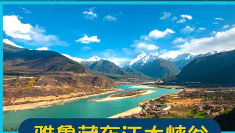
雅魯藏布江大峽谷