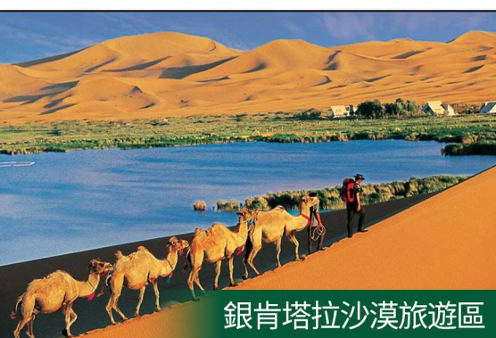
銀肯塔拉沙漠旅遊區