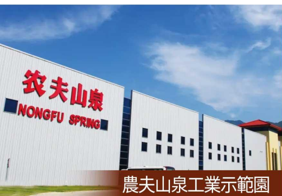
農夫山泉工業示範園