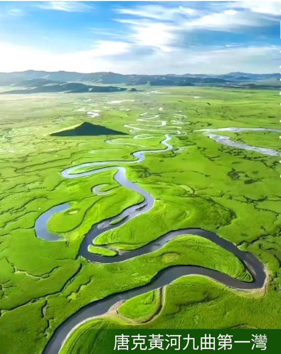
唐克黃河九曲第一灣