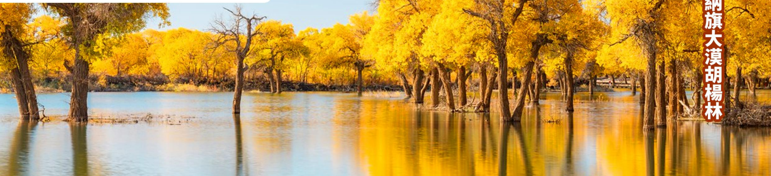
額濟納旗大漠胡楊林

酒店早餐 → 【青海省博物館】瞭解青海的歷史文化 → 西寧國際機場 → 返回香港國際機場 → 自由解散