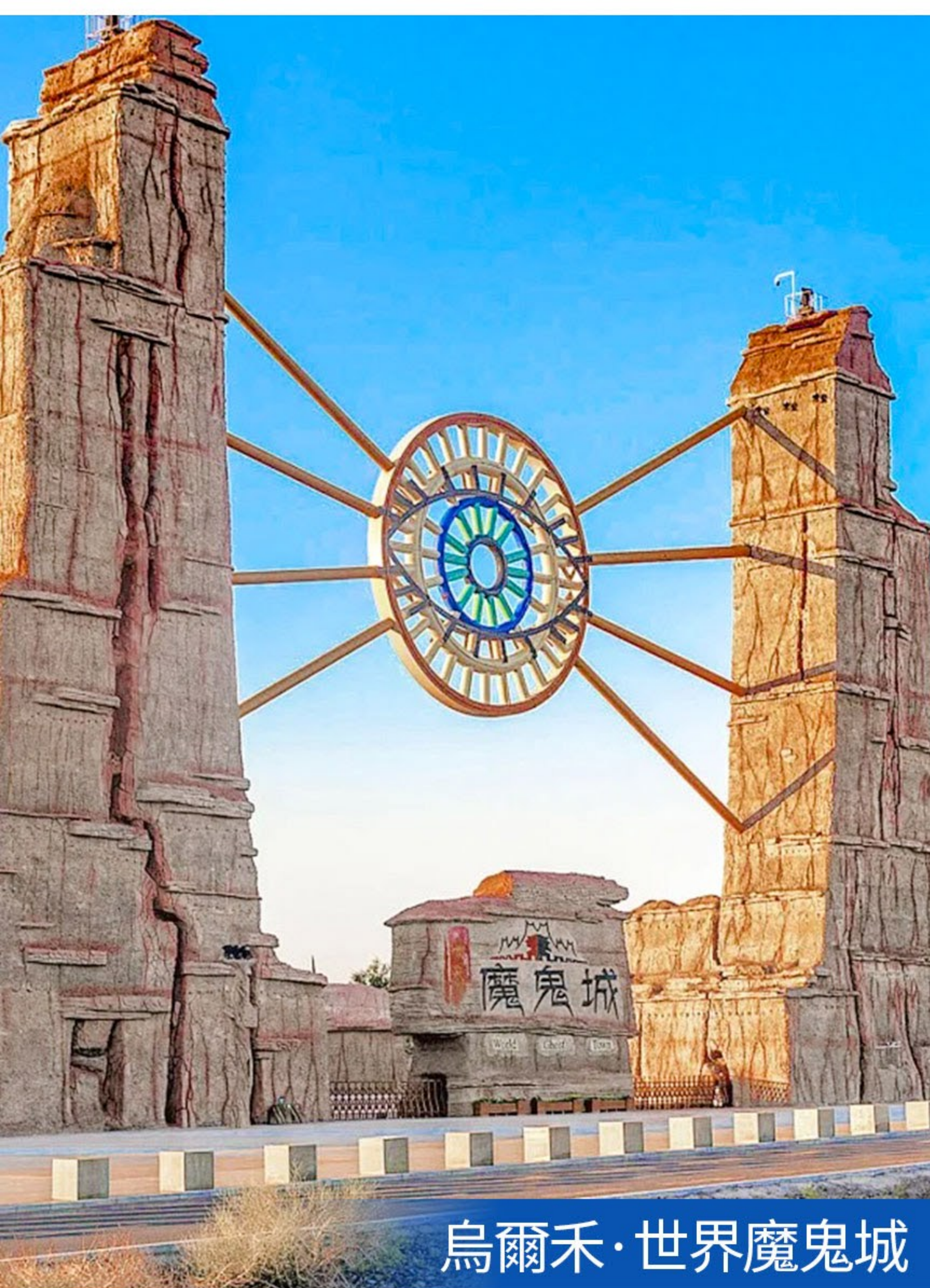
烏爾禾·世界魔鬼城