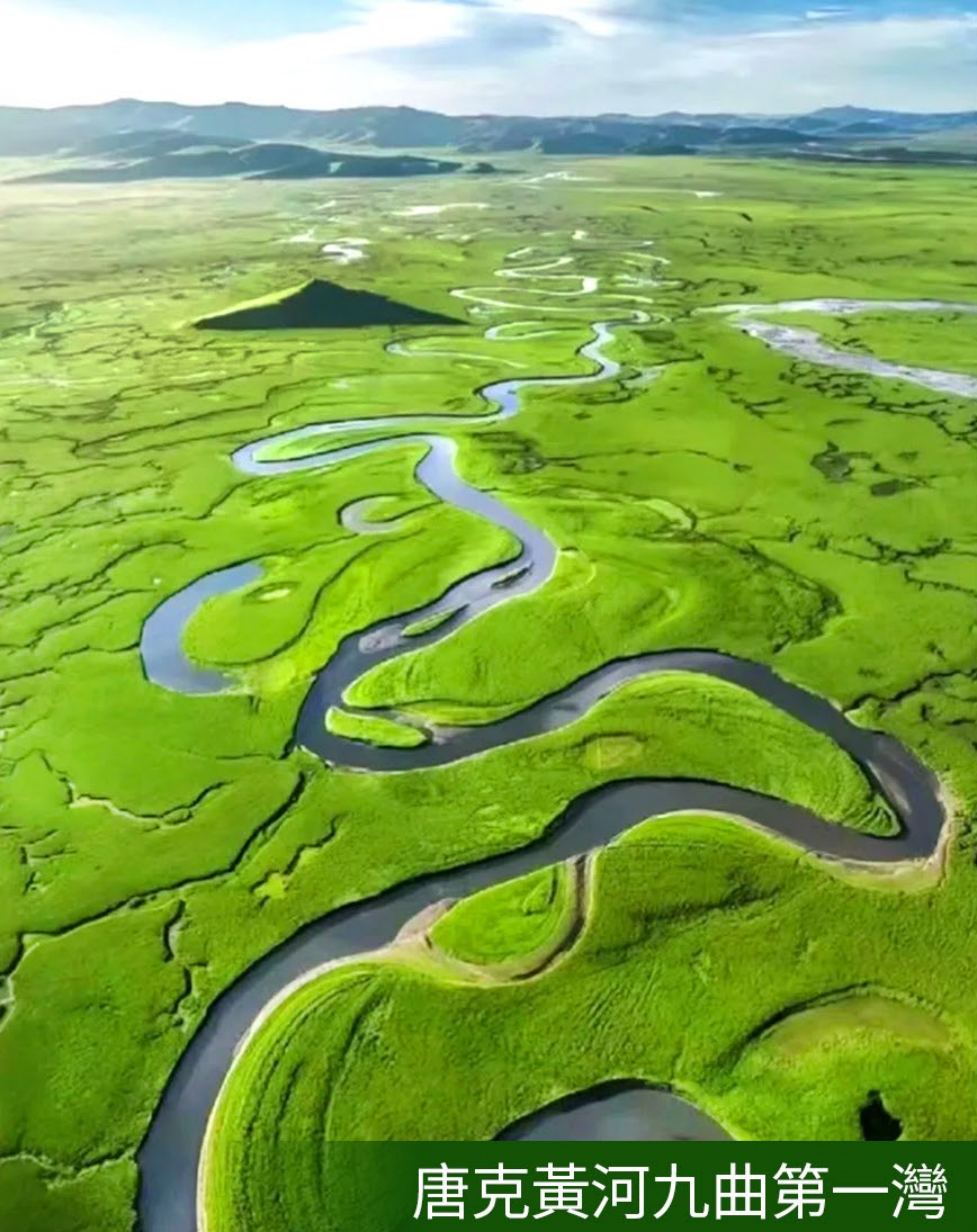
唐克黃河九曲第一灣