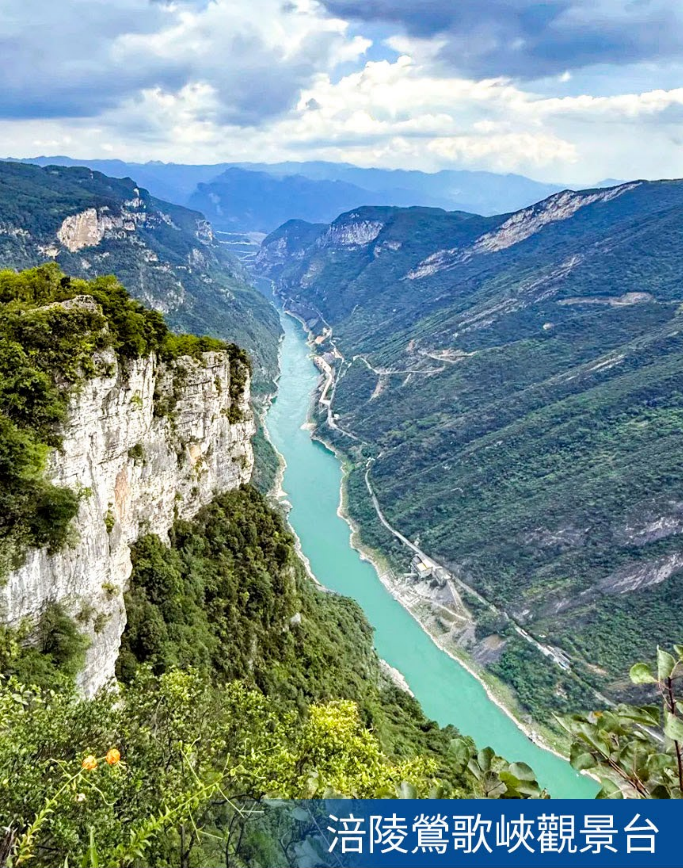
涪陵鶯歌峽觀景台