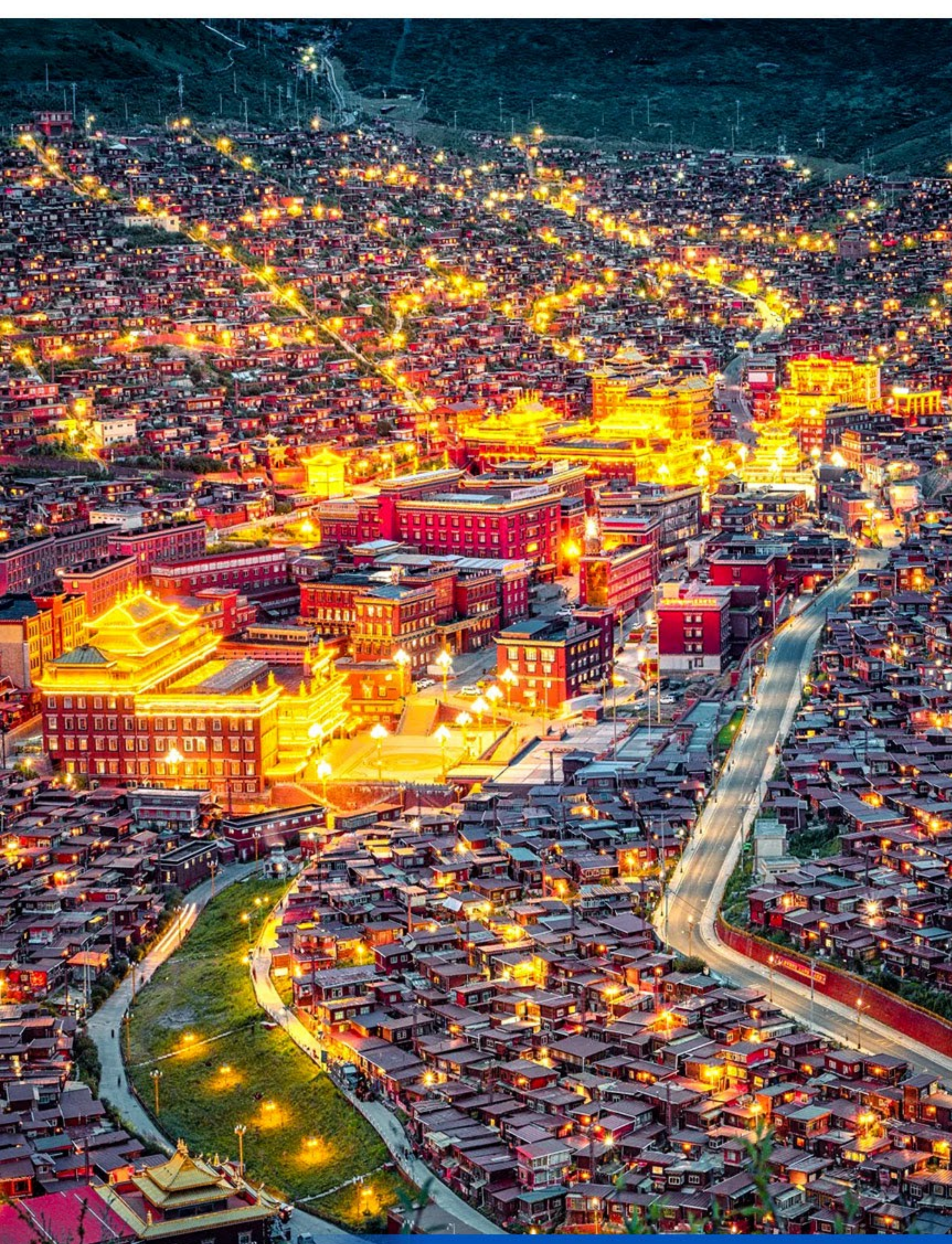
色達喇榮五明佛學院