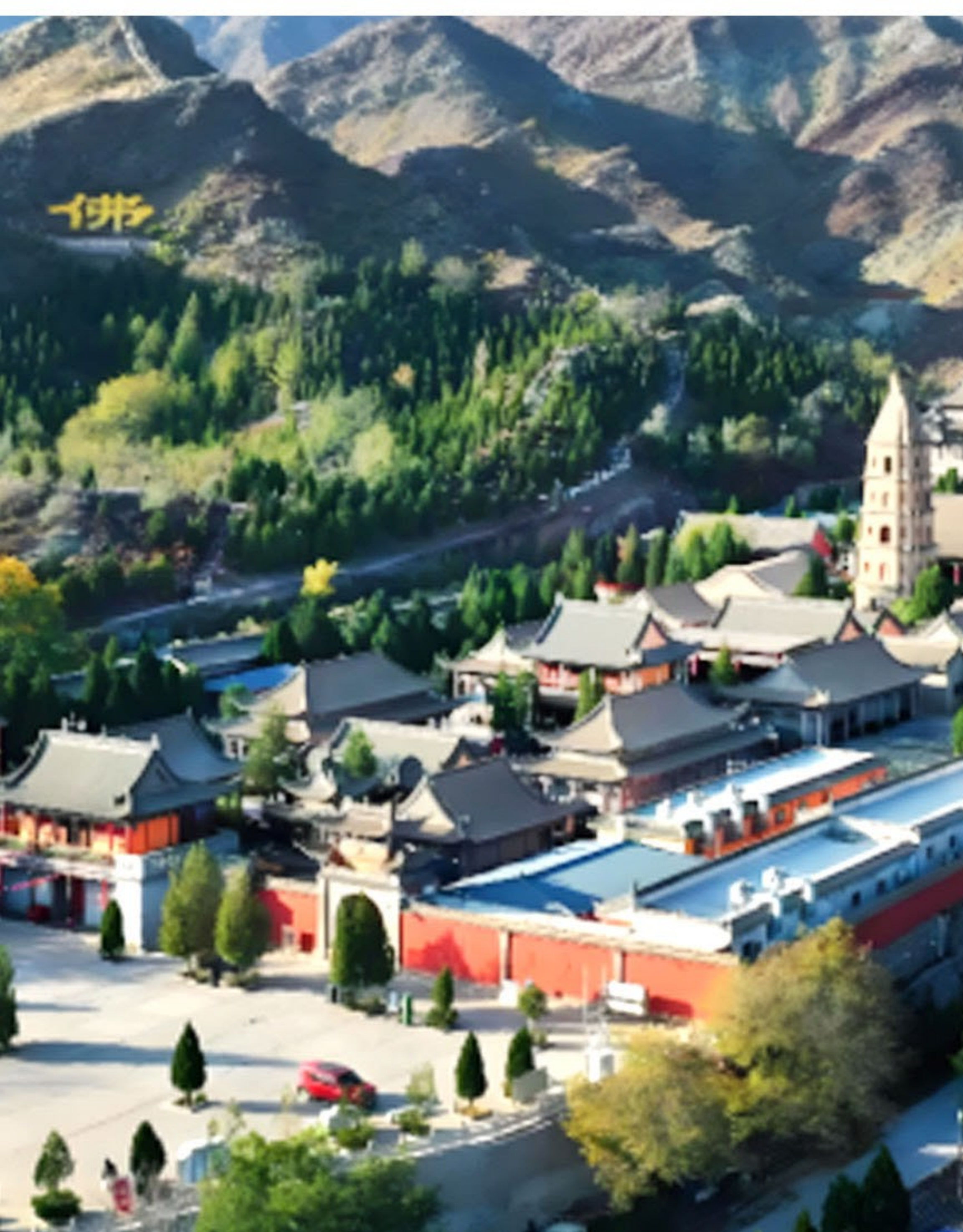
北武當生態風景區