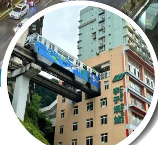
李子壩輕軌站穿樓 團號:CGCQ05SP 高速鐵路 High Speed Rail