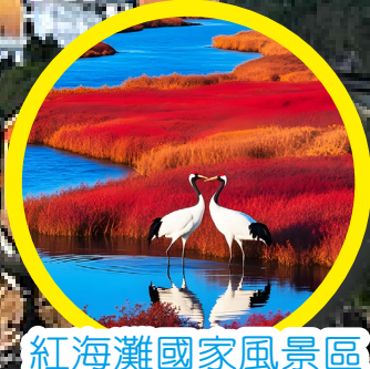
紅海灘國家風景區