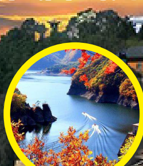
關門山國家森林公園