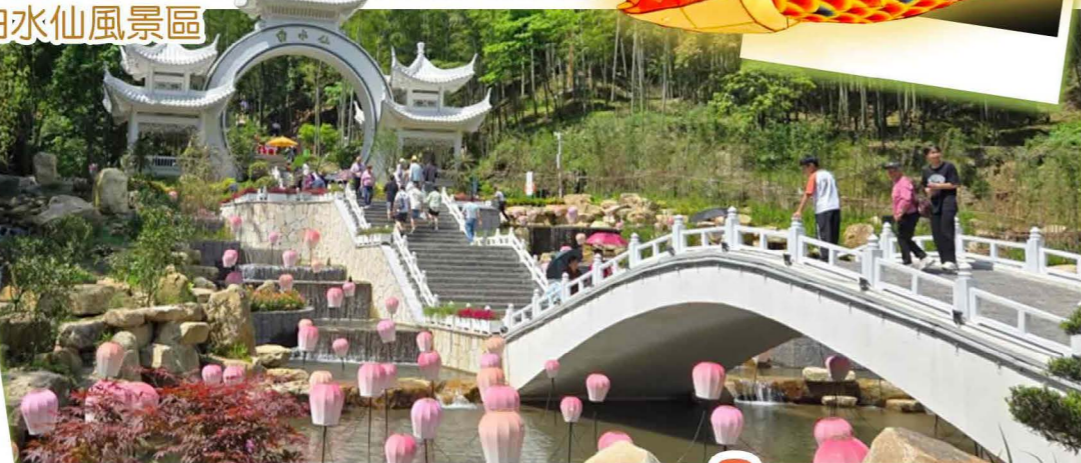
純玩3天 團號: LNNH03A