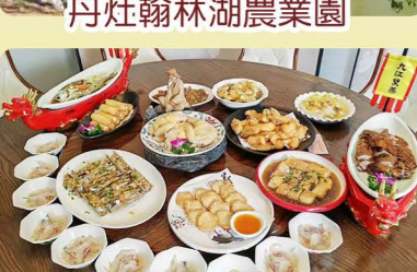
丹灶翰林湖農業園 順德功夫魚+九江龍船宴

Day 1 深圳指定關口集合→乘坐國內旅遊車→廣州→午餐【鼎盛私廚大魚四食宴】→海上絲綢之路“粵海第一關”【黃埔古巷】→乘坐廣州獨有最美七公里【有軌電車】(穿越花城春天花海觀景長廊及珠江兩岸璀璨美景)→重本包乘 珠江日落霞遊船 (全程約 1 小時, 沿途觀賞珠江兩岸美景、獵德大橋、“小蠻腰”廣州塔等)→晚餐【廣府粵韻味道家宴】→入住酒店→酒店附近行街、宵夜很方便 溫馨提示: 珠江遊船票採用實名制, 報名時需提供【回鄉證: 姓名、證件號及出生年月】