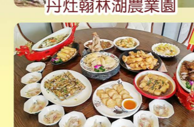
丹灶翰林湖農業園 順德功夫魚+九江龍船宴

Day 1 深圳指定關口集合→乘坐國內旅遊車→廣州→午餐【鼎盛私廚大魚四食宴】→海上絲綢之路“粵海第一關”【黃埔古巷】→乘坐廣州獨有最美七公里【有軌電車】(穿越花城春天花海觀景長廊及珠江兩岸璀璨美景)→重本包乘 珠江日落霞遊船 (全程約 1 小時, 沿途觀賞珠江兩岸美景、獵德大橋、“小蠻腰”廣州塔等)→晚餐【廣府粵韻味道家宴】→入住酒店→酒店附近行街、宵夜很方便 溫馨提示: 珠江遊船票採用實名制, 報名時需提供【回鄉證: 姓名、證件號及出生年月】