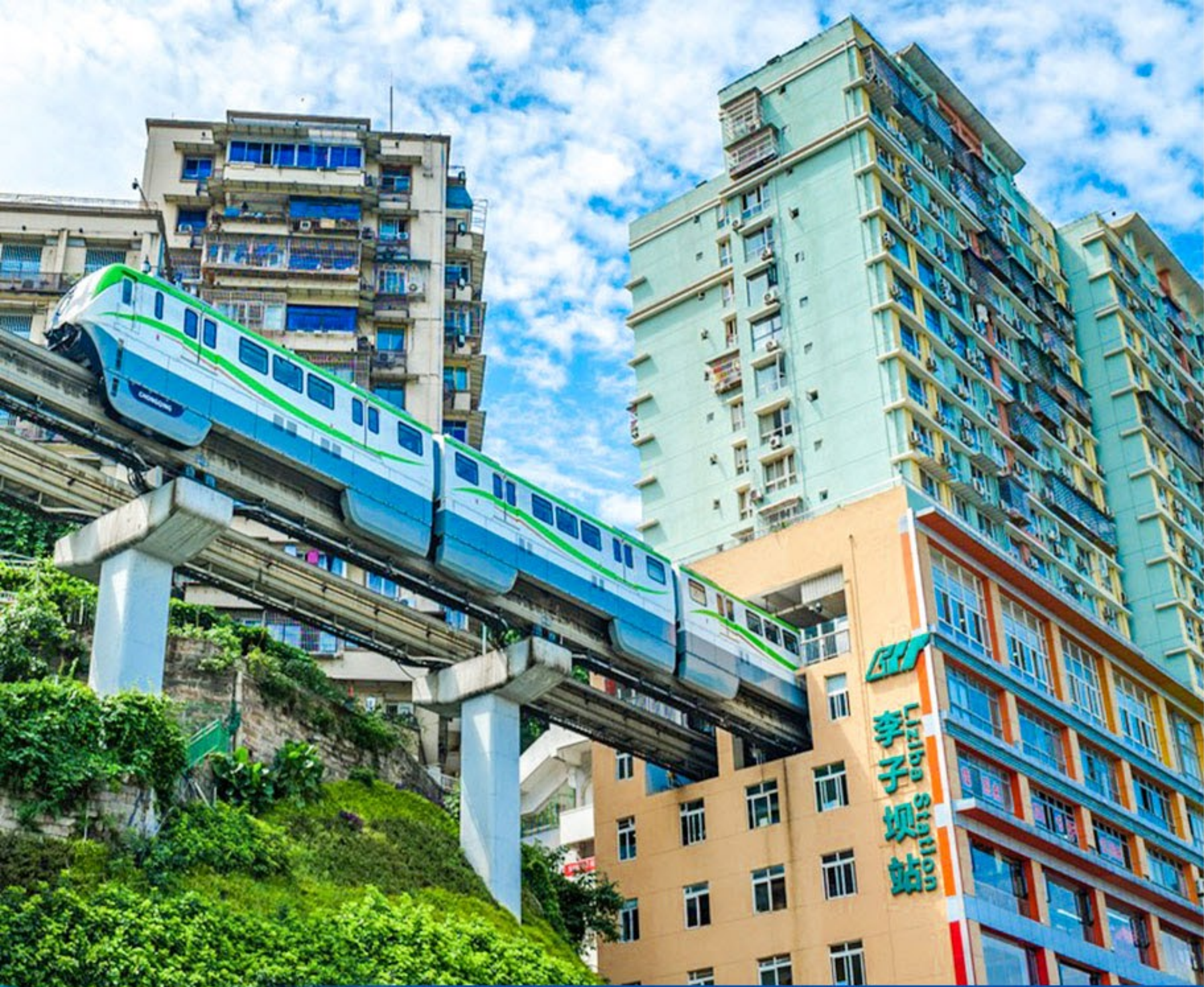
李子壩輕軌穿樓觀景平台