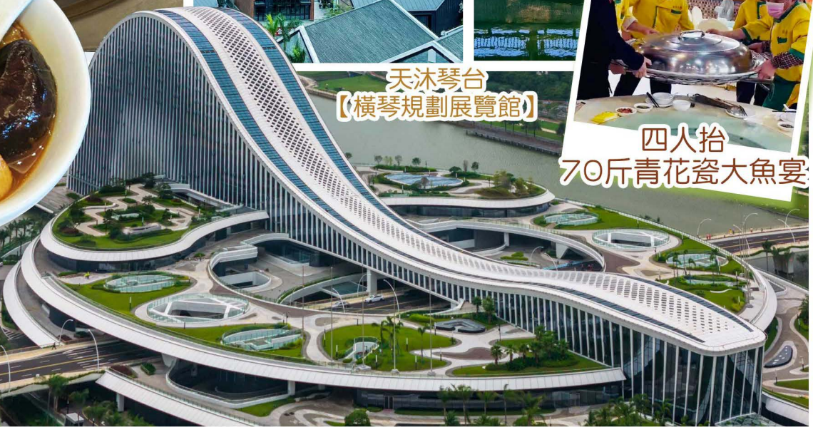
天沐琴台 【橫琴規劃展覽館】