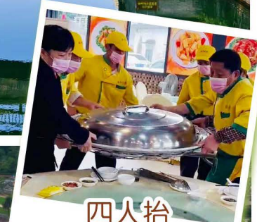
四人抬 70斤青花瓷大魚宴