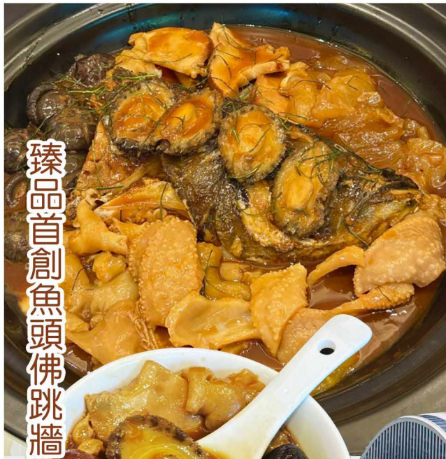
臻品首創魚頭佛跳牆