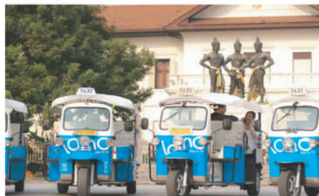
特色TUK TUK車遊清邁古城