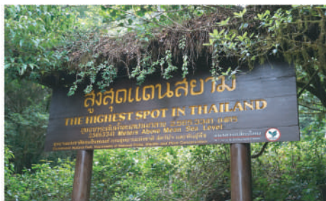
泰國國家最高點紀念點

是日遊走於泰國海拔最高的茵他儂國家公園,有別於泰國一貫的旅遊體驗,淳樸風景讓訪客洗滌心靈融入大自然之中