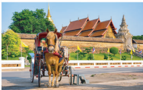
特色馬車遊覽南邦市區

走進百年歷史 公雞陶器工廠 , DIY親身體驗及 乘馬車遊覽南邦市區 穿越時間的文化之旅, 其後再前往泰國北部重鎮---清萊