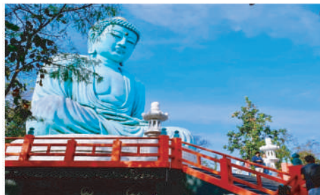
南邦府帕禪山佛塔寺