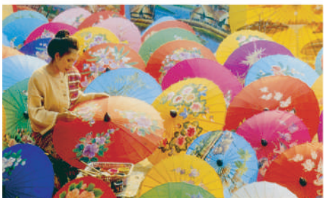
博桑傘村泰北文化體驗DIY