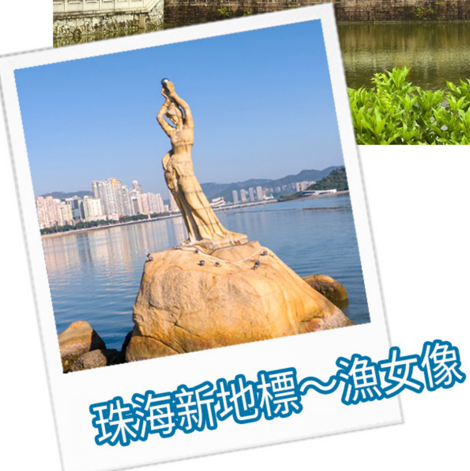
珠海新地標~漁女像