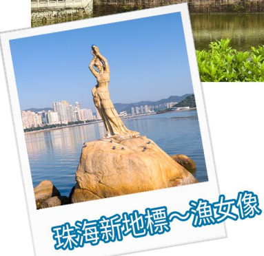
珠海新地標~漁女像