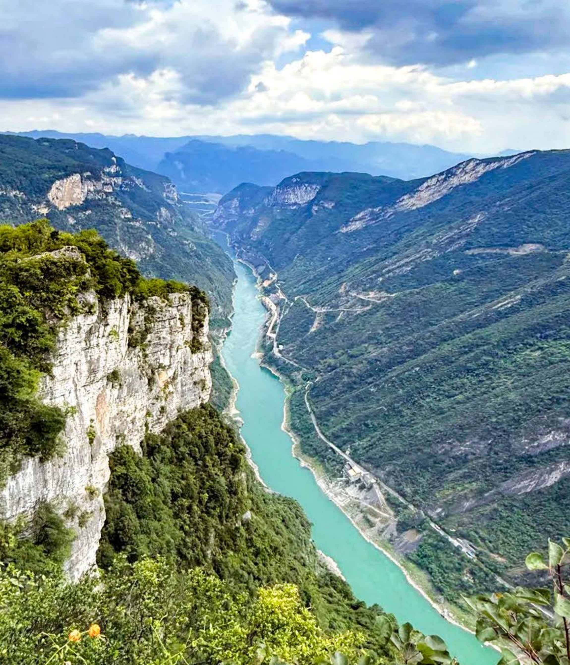
涪陵鶯歌峽觀景台