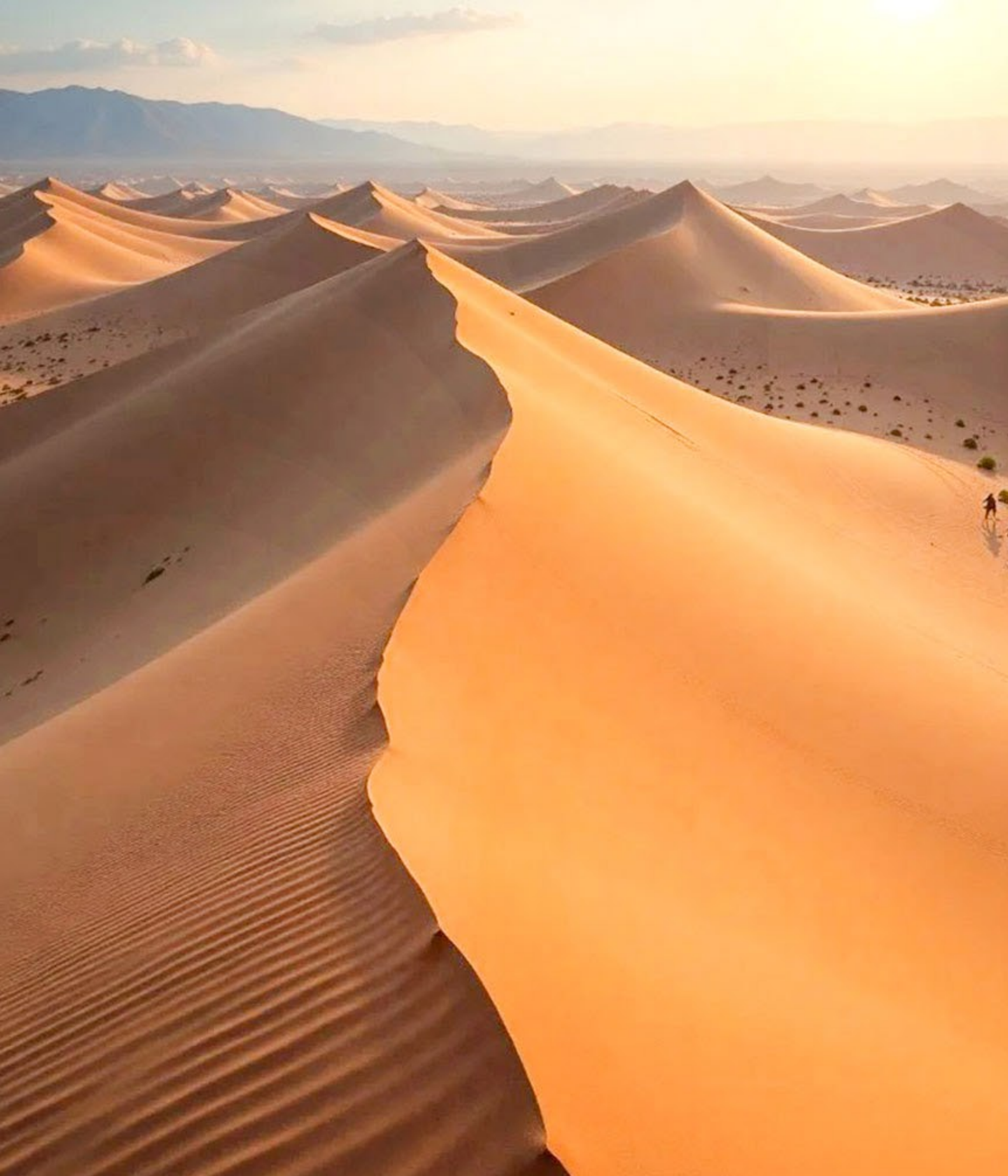
銀肯塔拉沙漠旅遊區