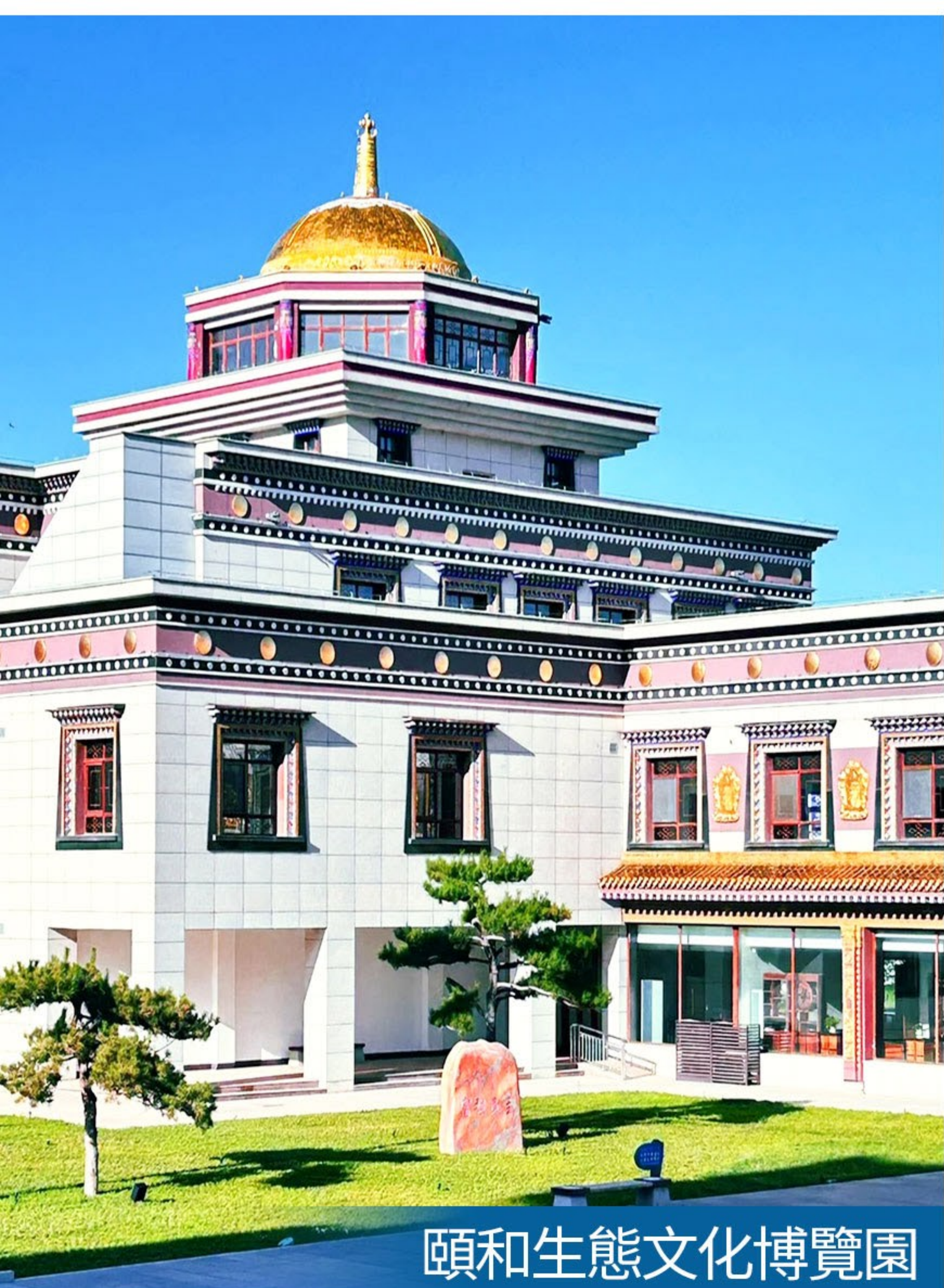
頤和生態文化博覽園