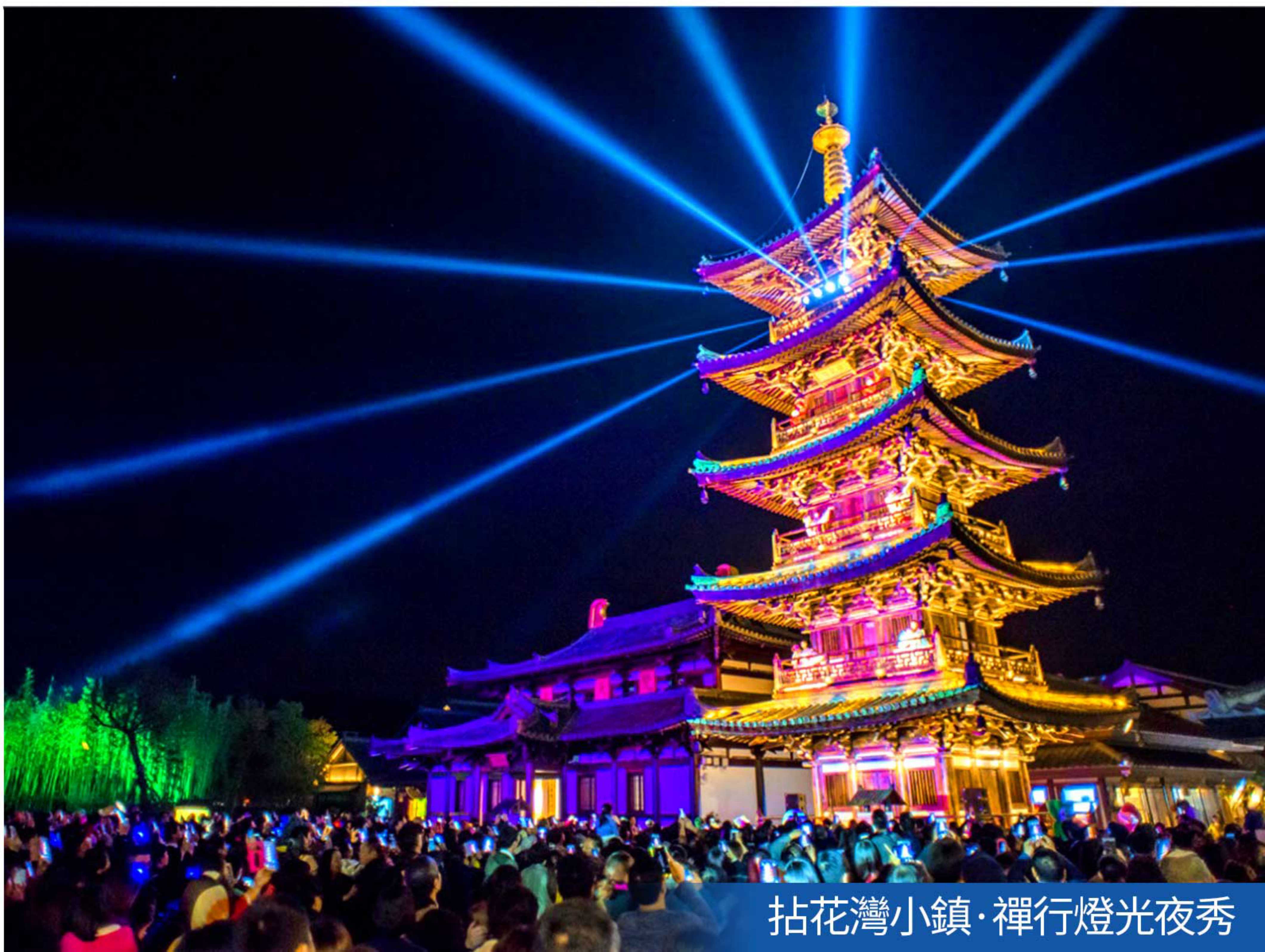
拈花灣小鎮·禪行燈光夜秀

酒店早餐---梅塢探早---龍井問茶---“天然氧吧”雲棲竹徑---指定時間送機，搭乘航班返回香港 抵達後散團