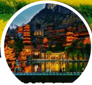
峰林布依風景區夜景