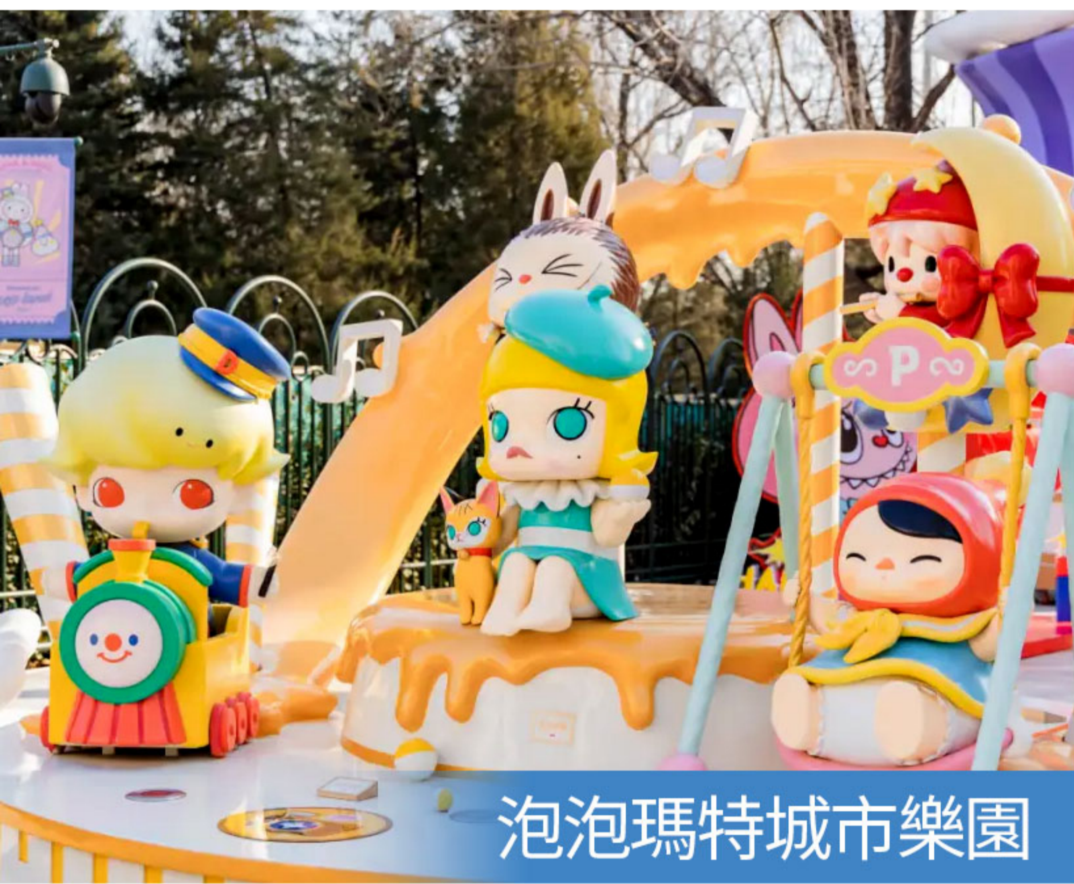
泡泡瑪特城市樂園