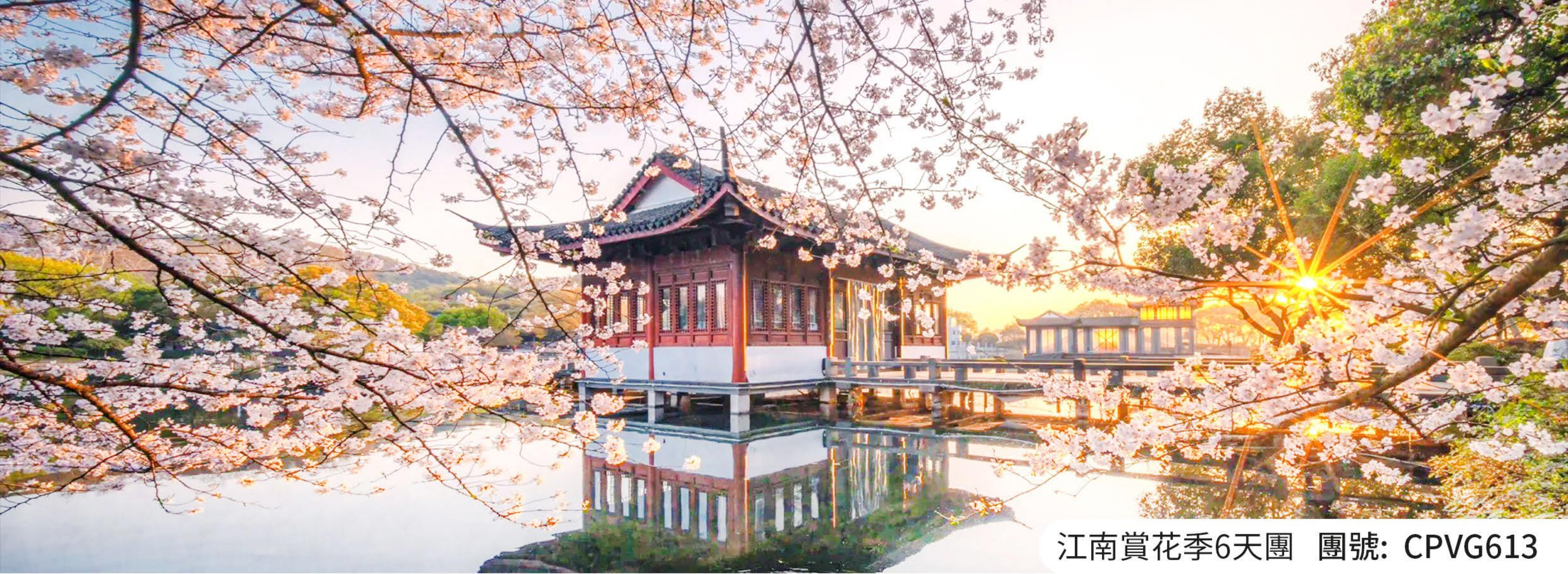
江南賞花季6天團 團號: CPVG613