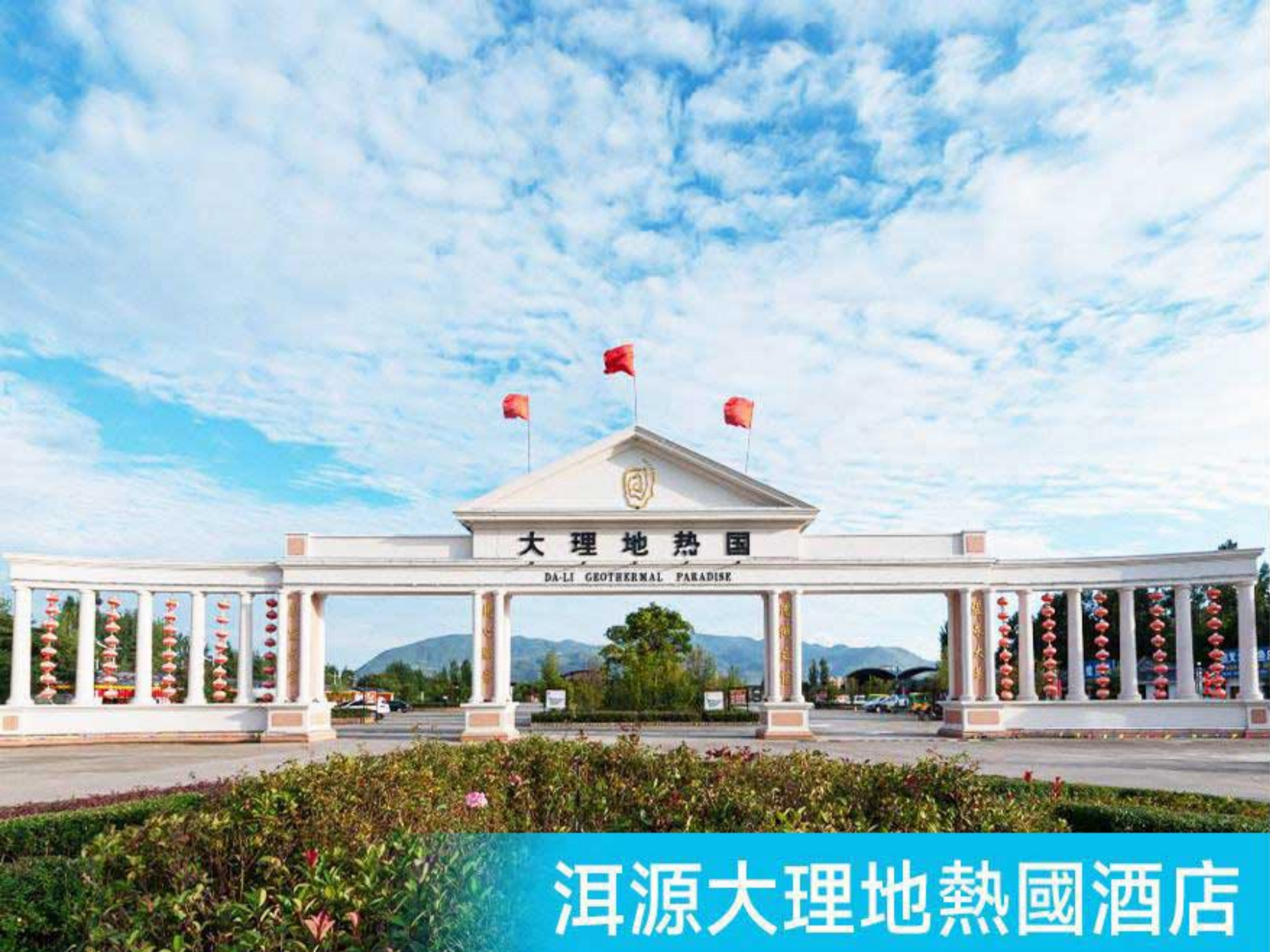
洱源大理地熱國酒店