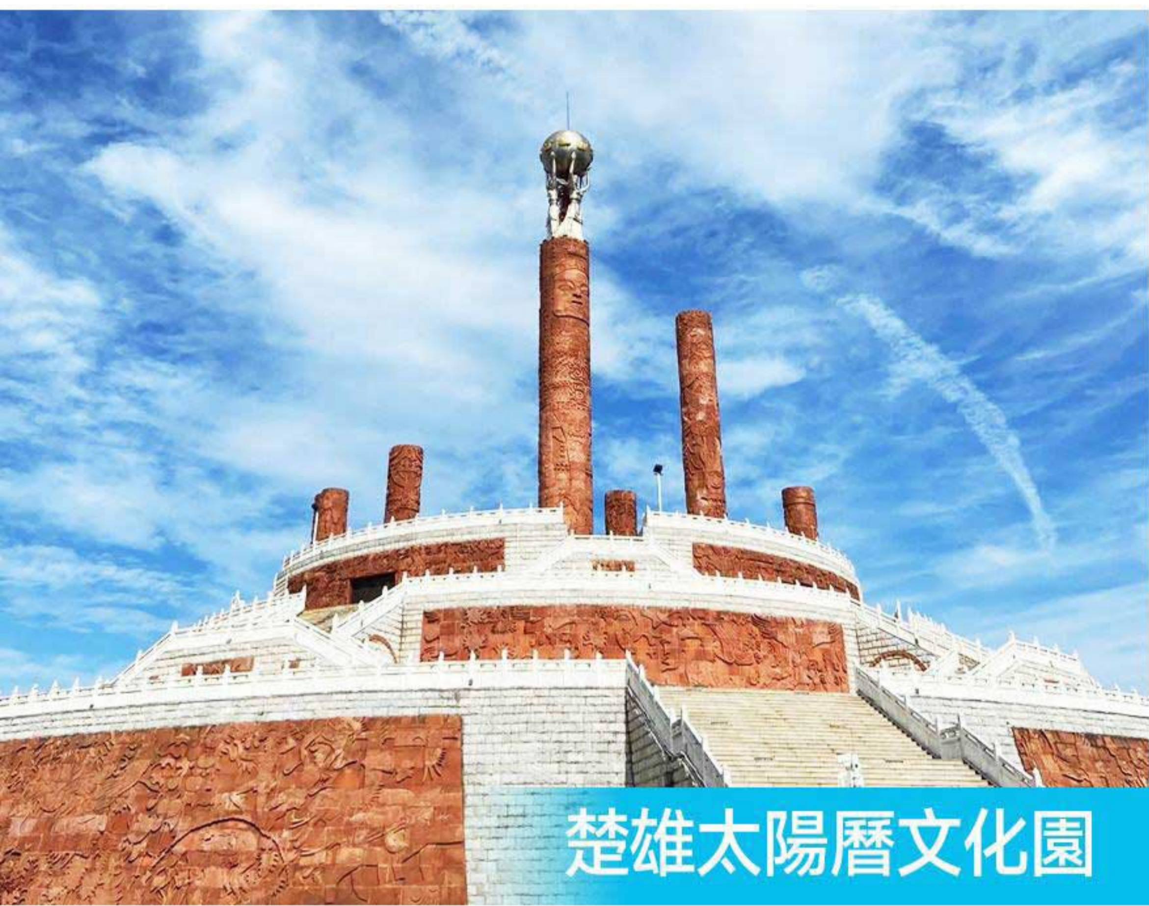
楚雄太陽曆文化園