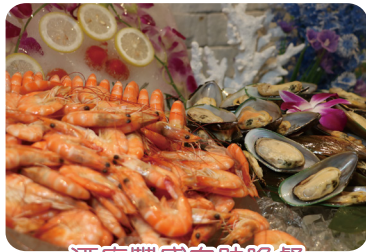
酒店豐盛自助晚餐