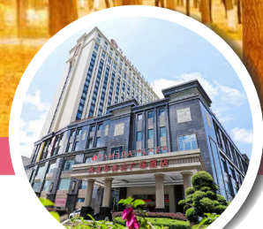
韶關風度華美達廣場酒店