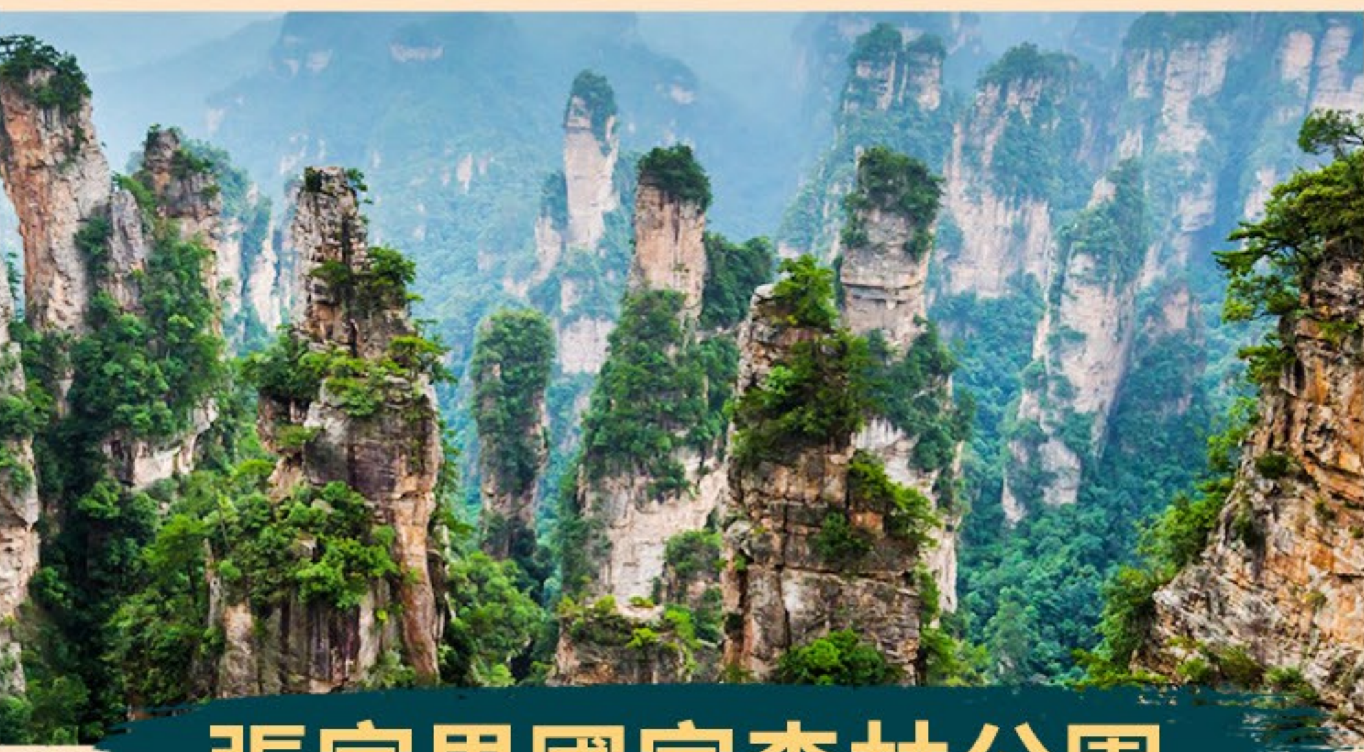
張家界國家森林公園