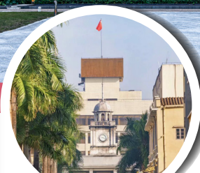
台城歷史文化街區