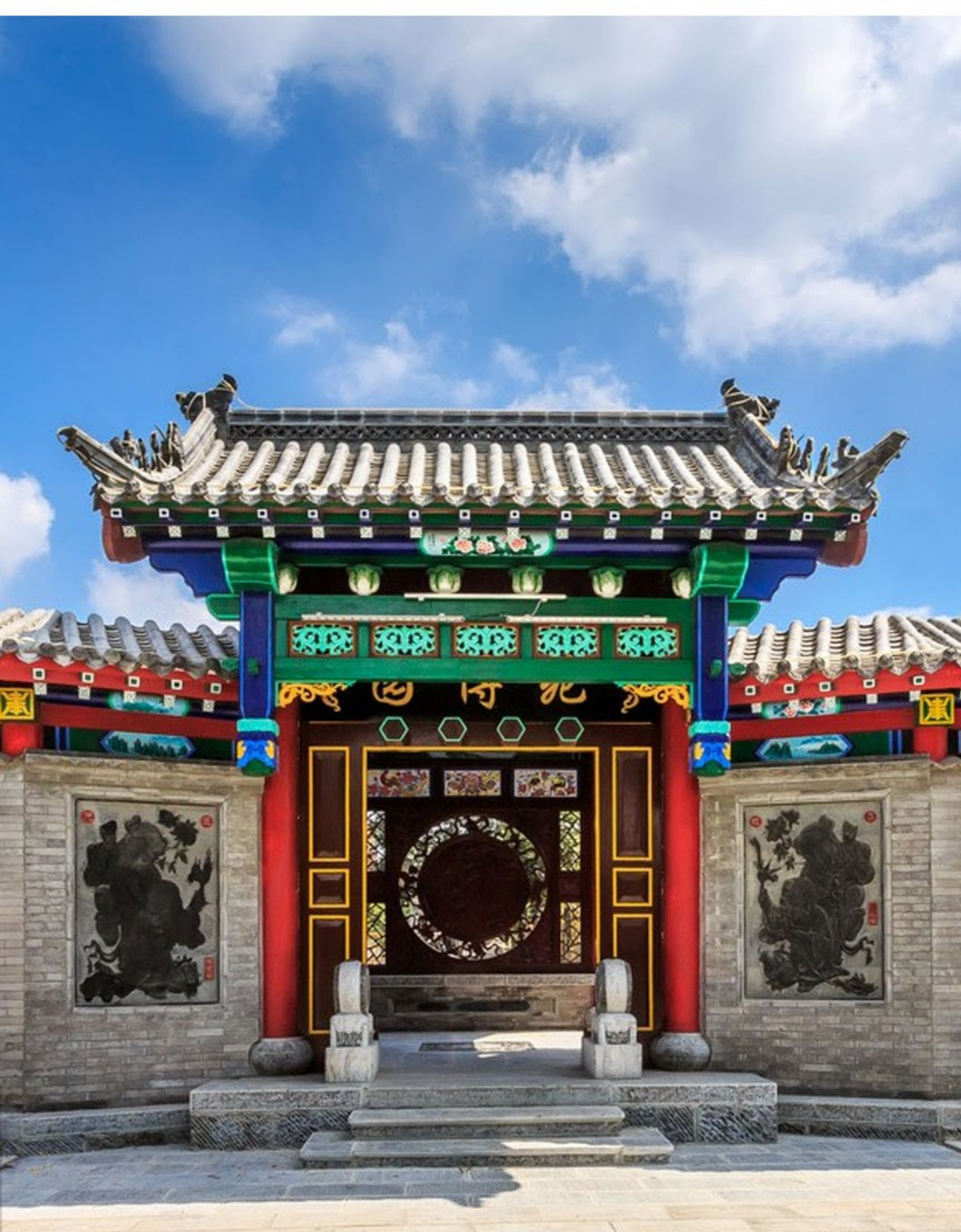
濰坊楊家埠民俗大觀園